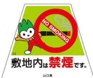
敷地内完全禁煙用

禁煙・分煙対策に取り組んでいる事業所に、「やまぐち健康応援団」への登録申請後、許可が出た後に登録証およびステッカー（下図）を交付しています。